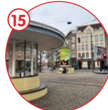
Rotonde Van Limburg Stirumplein