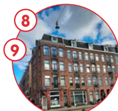
Geboortehuis Gerard Reve en verborgen kunstwerk