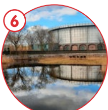
Westergasfabriek en 2 Gashoudervijvers