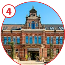
Conscious Hotel Westerpark/Bar Kantoor