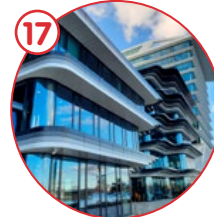
Designerboulevard aan het IJ