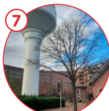
Eenkamerhotel, Watertoren en Café-Restaurant Amsterdam