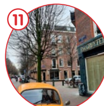
Groen van Prinstererstraat