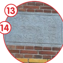
Van Beuningenstraat via Fannius Scholtenstraat