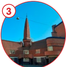
Museum Het Schip