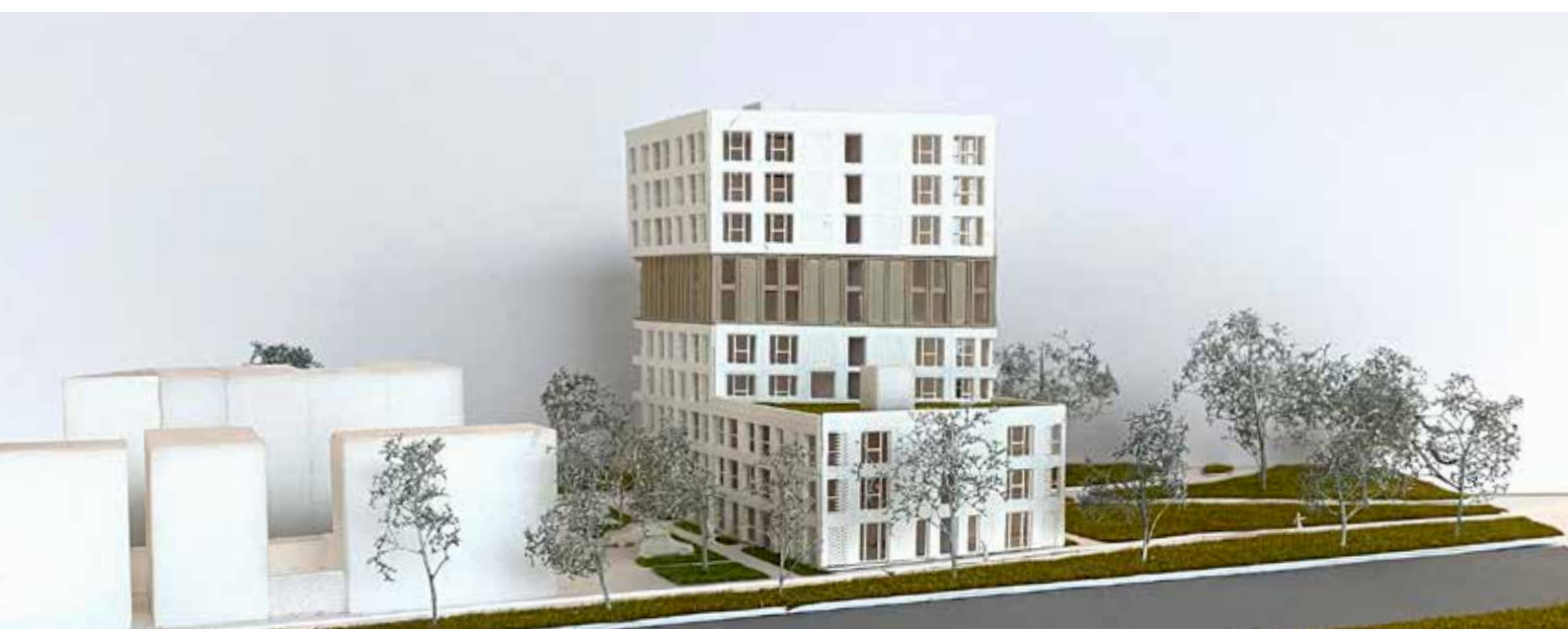
Maquette nieuwbouw IJsselmeerstraat

Het moment dat u een zienswijze kunt indienen hangt af van wanneer Rochdale de plannen indient bij de gemeente. We zijn van plan om in december 2021 of januari 2022 de documenten in te dienen. Dat betekent dat u in het voorjaar van 2022 officieel zes weken inspraak heeft. Meer hierover vindt u op de website van de gemeente.