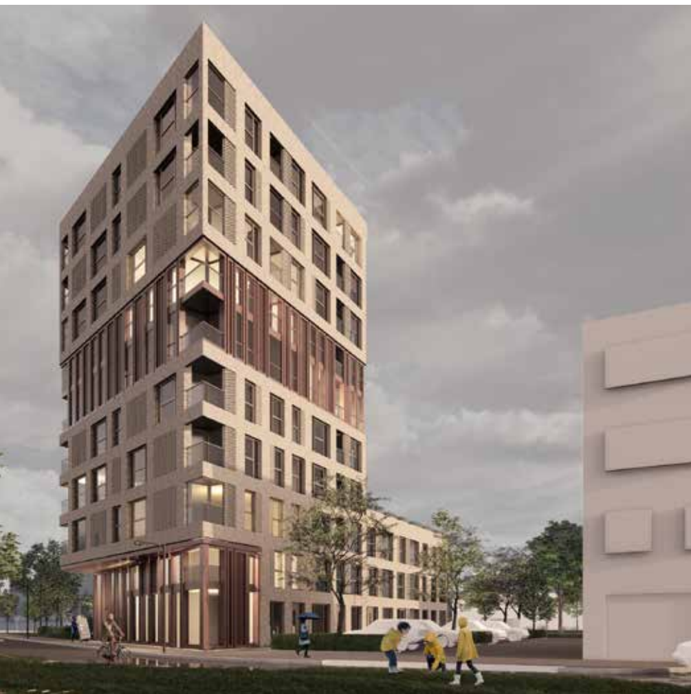
Lichte baksteen en roestkleurig materiaal

In de zomer van 2021 zijn er twee participatiebijeenkomsten voor omwonenden geweest. Bewoners noemden verschillende thema's waar Rochdale zoveel mogelijk rekening mee probeert te houden. Het resultaat hiervan is te zien in het Definitief Ontwerp. We hebben oplossingen gezocht voor de volgende thema's: